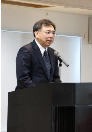
↑ 堀本金融庁総合政策局長は「岩手モデルを全国へ」と期待