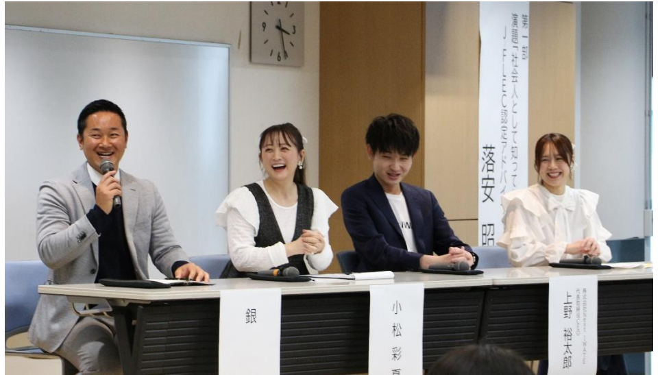
↑ 楽しい学びを提供してくれたパネリストの皆さん