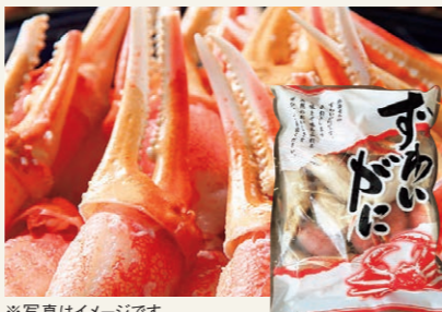
※写真はイメージです。 ※商品自体はリングカットが入っているだけで、写真のように剥かれておりません。