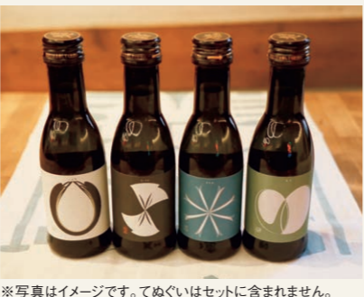
※写真はイメージです。てぬぐいはセットに含まれません。

「山田錦」「雄町」「酒未来」「愛山」の4種の酒造好適米で醸した純米大吟醸の呑みくらべが楽しめるセットです。南部美人で「ビューティーシリーズ」として親しまれている商品を特別に小容量でご用意しました。