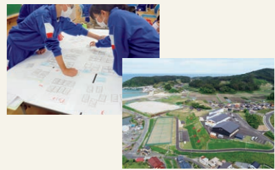
ひろたハマラインパークでの震災学習風景と施設全景の写真です。郷土を愛し、復興・発展を支える人材を育てています。

平成23年東日本大震災津波により、岩手県では、親を失った子どもが多数確認されています。また、被災地では親が仕事を失った子どもたちも多く、厳しい経済状況に置かれています。こうした子どもたちが自らの希望に沿った学校を卒業し、社会人として立ち立つまで、息の長い支援を行うことを目的に、県では、平成23年6月に「いわての学び希望基金」を設置し、全国の皆さまからの善意の寄附を広く募っています。詳しくは、岩手県ホームページをご覧ください。https://www.pref.iwate.jp/