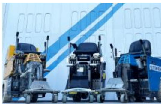
乗用式床ハガシ機