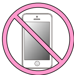
スマートフォン (携帯電話を含む)