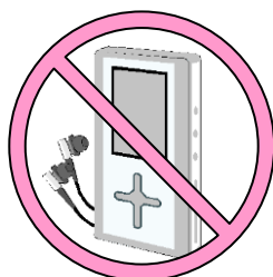
A V 機器