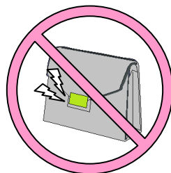
磁気仕様の留め金