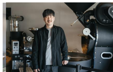
【NAGASAWA COFFEE 店舗】